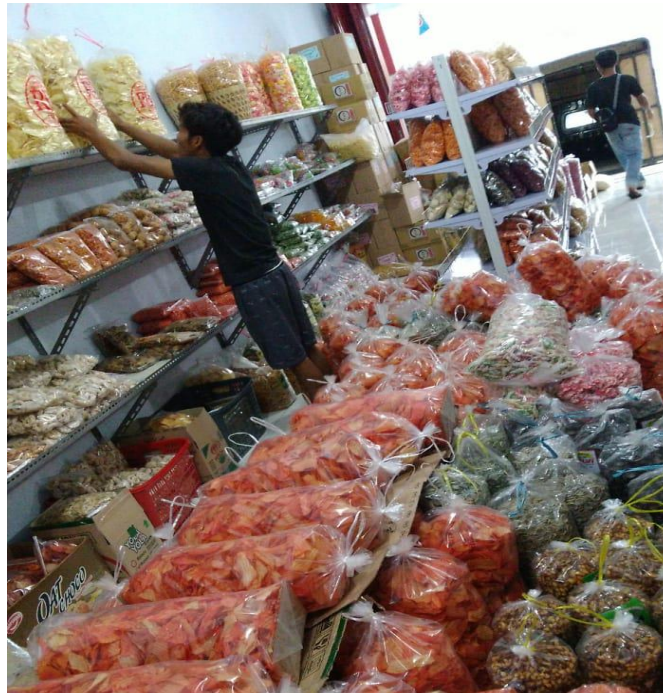
Gambar 3 Proses Pendistribusian Produk