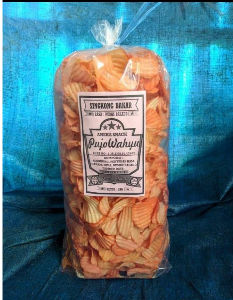
Gambar 2. Brand atau Label pada Kemasan Produk

Produk UMKM tersebut sebelumnya hanya dikemas tanpa disertakan label atau brand . Biasanya produk tersebut dibeli oleh pengepul untuk dikemas dan dijual kembali. Oleh karena itu, pengabdian dalam melaksanakan kegiatan pengabdian ini berupaya membuat sebuah label atau brand yang nantinya akan ditempel pada kemasan produk makanan ringan tersebut.