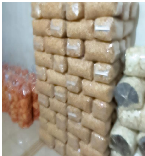
Gambar 4 Pengemasan Produk