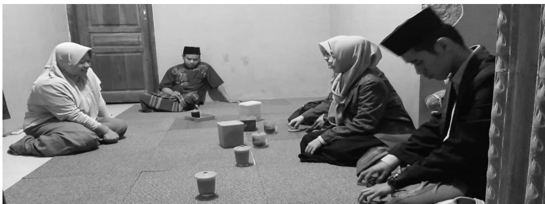
Gambar 1 : wawancara dengan kepengurusan Lembaga Madrasah Diniyah Nibrosul Athfal

Hasil wawancara di atas menunjukkan bahwa kurangnya SDM pengajar dan waktu serta metode yang akan diterapkan program pembelajaran pemecahan masalah haid, nifas, istihadloh dan thoharoh di lembaga Madrasah Diniyah Nibrosul Athfal. Sedangkan untuk mengatasi masalah tersebut pendamping melakukan pendampingan implementasi metode pembelajaran dengan menerapkan kitab Uyunul Masail serta memberikan motivasi kepada ustadzah untuk mengembangkan dan menerapkan kegiatan pengajian kitab Uyunul Masail kepada anak perempuan.