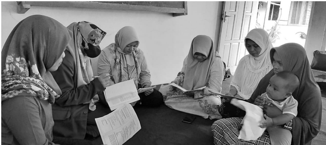
Gambar 3. Kegiatan diskusi pemecahan masalah

Adapun model pembelajaran yang digunakan oleh pendamping yakni ceramah diskusi dan juga tanya jawab, disesuaikan dengan materi yang sedang berlangsung saat itu. Diawali dengan pemberian materi, diskusi, dan tanya jawab.