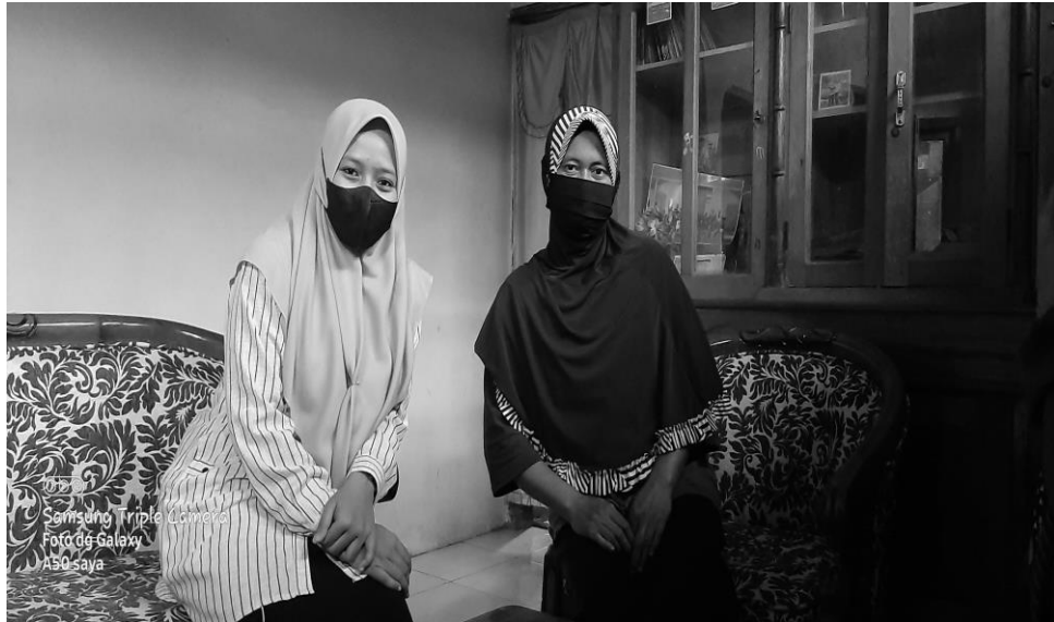
Gambar 2. Hasil wawancara dengan kepengurusan jamaah pengajian rutin ibu-ibu

Serta kurangnya SDM ustadzah pembimbing untuk pembekalan fikih wanita.