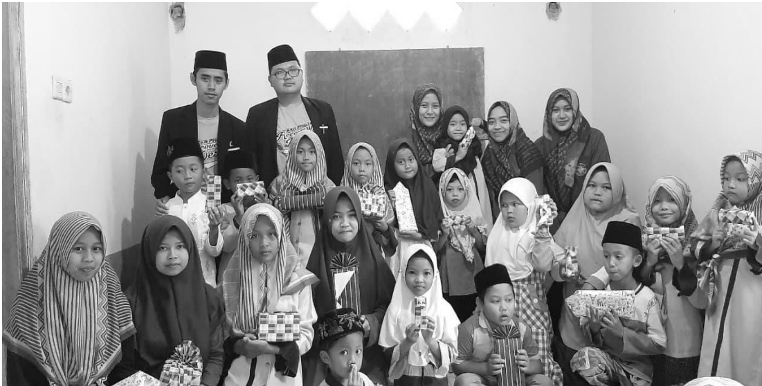
Gambar 9. Pemberian Apresiasi