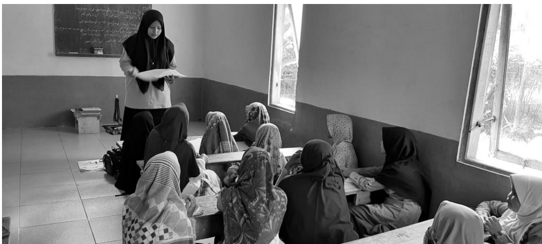
Gambar 4. Kegiatan ceramah pembelajaran kajian kitab Uyunul masail