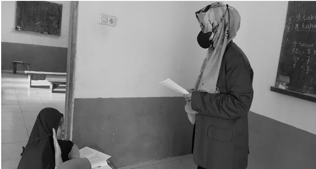
Gambar 5. Kegiatan tanya jawab mengenai materi yang belum dimengerti

Sedangkan media pembelajaran yang digunakan oleh pendamping yakni menggunakan media tradisional papan tulis, buku pembelajaran kitab Uyunul Masail dengan menggabungkan metode ceramah dan tanya jawab pada proses pembelajarannya dan didalam proses tersebut pendamping yang sedang melakukan diskusi juga memberikan kesempatan kepada ibu-ibu jamaah rutin pengajian dan anak perempuan Dusun Krutuk pada saat proses belajar berlangsung maupun di akhir pembelajaran.