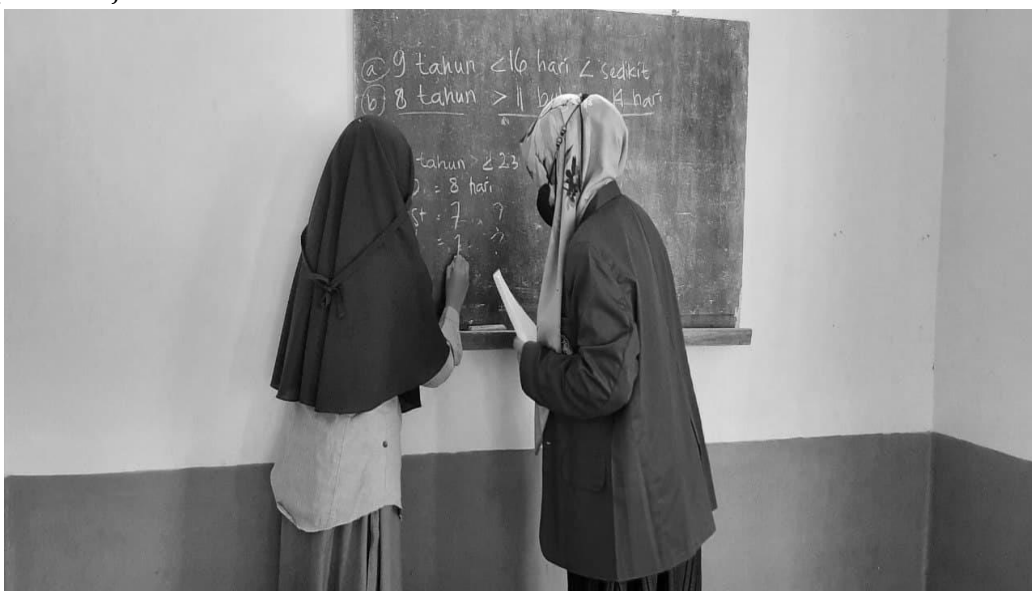
Gambar 6. Media pembelajaran menggunakan papan tulis

Sedangkan media pembelajaran yang digunakan oleh pendamping yakni menggunakan media tradisional papan tulis, buku pembelajaran kitab Uyunul Masail dengan menggabungkan metode ceramah dan tanya jawab pada proses pembelajarannya dan didalam proses tersebut pendamping yang sedang melakukan diskusi juga memberikan kesempatan kepada ibu-ibu jamaah rutin pengajian dan anak perempuan Dusun Krutuk pada saat proses belajar berlangsung maupun di akhir pembelajaran.